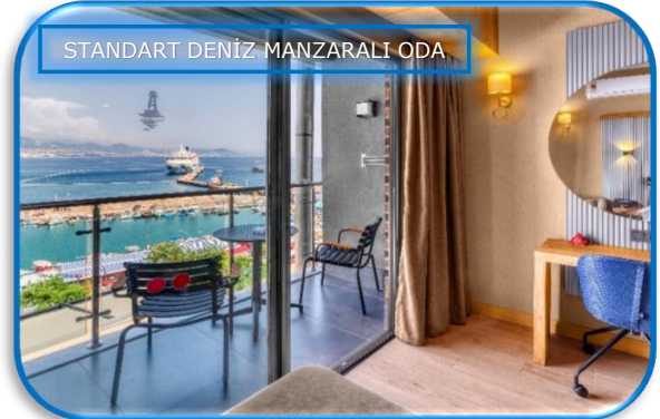
STANDART DENİZ MANZARALI ODA